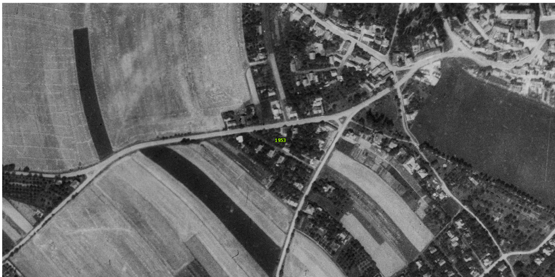
Ortofotomapa z roku 1953